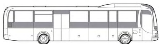
Lion's Regio C*